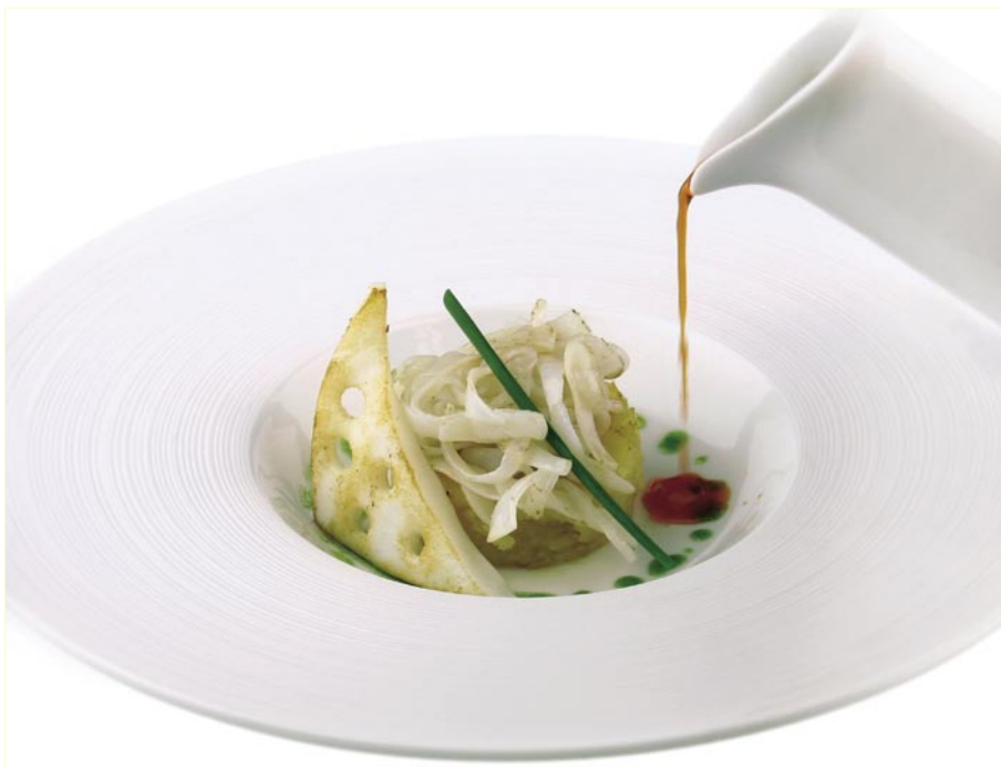
El chef Pepe Rosales propone un "Choco con patatas y su caldo con toque de orégano".